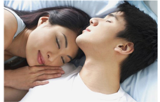
Ai cũng muốn tình yêu luôn còn mãi (Hình minh họa)

vậy, "thình thoảng cũng nghe mọi người bàn tán về việc có chi/em đi