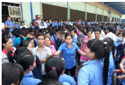
Cty Shilla Bags Việt Nam ngừng việc đòi quyền giải quyết nhu cầu tối thiểu

thiểu của con người như các công ty trên, những vấn đề trong quản lý và ứng xử khác thì người lao động có thể