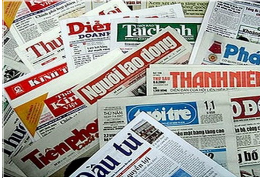
Báo chí, truyền thông hãy luôn giữ tinh khách quan (Hình minh họa)

đình hạnh phúc, những điều giản dị đời thường này như ngày càng khó khăn hơn bởi: “mang danh công nhân thì rất khó có người yêu: Không thời