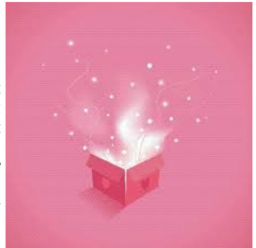
Chiếc hộp rỗng chứa đầy những nụ hôn của cô con gái chính là món quà vô cùng quý giá mà người cha luôn giữ bên mình