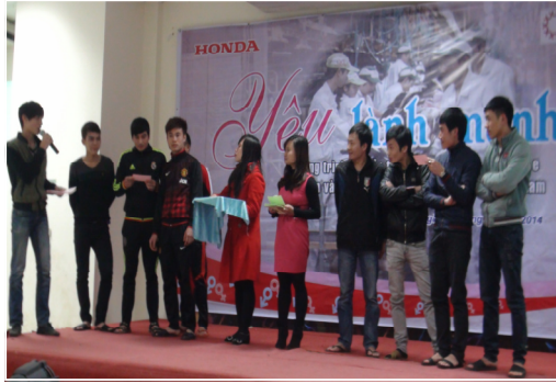
Công nhân cty Honda trong phần kịch tương tác tại chương trình truyền thông về SKSSTD

CSR là hướng tới sự phát triển bền vững của doanh nghiệp và tăng khả năng hội nhập vào thị trường quốc tế.